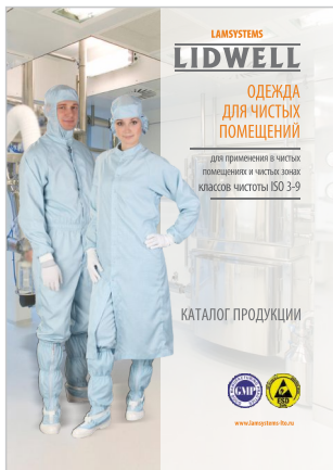
ОДЕЖДА ДЛЯ ЧИСТЫХ ПОМЕЩЕНИЙ